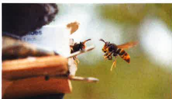
Nest Aziatische hoornaar te Evergem in alarmfase door benadering brandweer: werksters komen massaal buiten het nest.